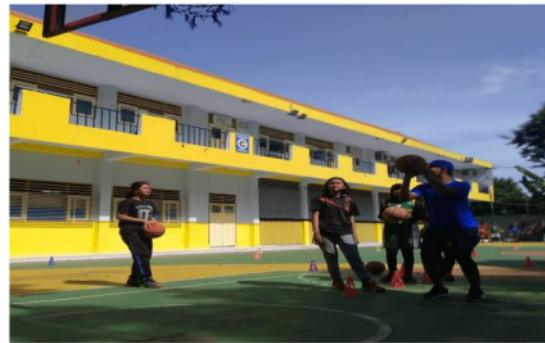
Gambar kegiatan latihan teknik dasar 2

Implikasi untuk pengabdian ini berdampak pada pemain dengan beraktivitas gerak berdasarkan teknik dasar dengan lancar dan benar. Dengan kegiatan ini berdampak positif dengan pentingnya belajar teknik dasar sejak kecil supaya memberi pengaruh kedepannya dengan latihan secara terus-menerus dengan baik. Pemain harus aktif melakukan gerakan dalam permainan bola basket dengan menerapkan teknik yang benar supaya berdampak terhadap prestasi melalui permainan bola basket.