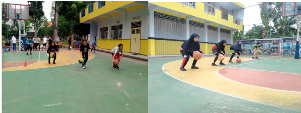
Gambar kegiatan latihan teknik dasar 1

Setiap pemain harus menguasai teknik dasar permainan bolabasket dribbling, passing, shooting, di dalam bola basket menggiring bola merupakan hal yang tidak bisa di pisahkan pada setiap individu maupun tim, karena menggiring bola merupakan usaha setiap pemain untuk membawa bola ke depan sebagai tugas utama. Kunci dari semua keberhasilan dalam menyerang untuk setiap tim berdasarkan kemampuan passing pemain karena hal tersebut salah satu indikator setiap tim punya peluang untuk mendapatkan angka, setiap passing pemain harus dilaksanakan dengan cepat dan akurat itu termasuk kunci utama dan mempunyai kesempatan dalam memasukkan bola ke dalam ring. Untuk kemampuan shooting bisa dikatakan sebagai usaha sebuah tim atau pemain dalam memasukkan bola ke dalam ring sebanyak - banyaknya. Sehingga bisa dikatakan bahwa hasil dari bentuk latihan teknik dasar yang dilakukan saling berkaitan satu sama lain dari teknik dasar tersebut, bentuk latihan tersebut dapat menunjang kemampuan individu setiap pemain dan berdampak baik terhadap sebuah tim.