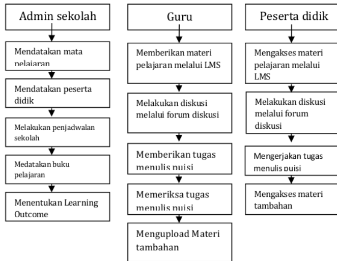
Gambar 1. Bagan Penggunaan LMS

LMS dalam pembelajaran melibatkan admin sekolah, guru, dan peserta didik. Masing-masing pengguna mempunyai peran yang berbeda dan teknis penggunaannya juga akan berbeda. Berikut langkah yang dilakukan dalam menggunakan aplikasi LMS. Penggunaan LMS dapat dilihat pada bagan pada gambar 1.