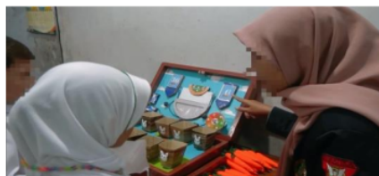
Gambar 1. Subjek FD dalam mengimplementasikan alat peraga