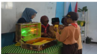
Gambar 2. Subjek FI dalam mengimplementasikan alat peraga