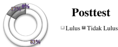
Grafik. Prosentase kelulusan uji Posttest

Berdasarkan grafik tersebut, diketahui bahwa 43% dari 30 siswa yang melaksanakan uji pretest ada 13 siswa yang dinyatakan lulus sesuai standar nilai KKM Bahasa Indonesia di sekolah SMA A. Wahid Hasyim Perak Jombang yaitu 70.