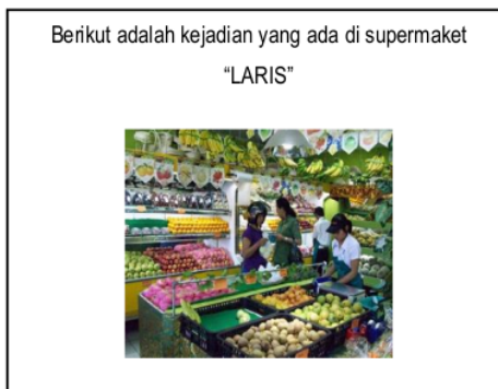
Gambar 1. Bentuk tes pengajuan soal tipe post solution posing

Dari Kedua Subjek di peroleh hasil bahwa Subjek F mengajukan soal sebanyak 7 soal yang dapat diselesaikan dengan 4 cara berbeda yaitu eliminasi, substitusi, campuran dan matriks. Subjek F mengajukan soal dengan konteks yang berbeda yaitu SPLDV dan Turunan yang baru menurut pengetahuannya yaitu pada soal nomor 6 dan 7 .