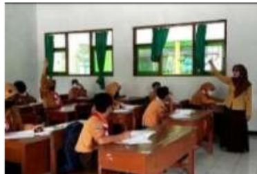
Gambar 1 Siswa aktif bertanya dan menjawab

Pada saat guru membahas latihan soal, seringkali guru bertanya tentang bagaimana langkah selanjutnya dalam mengerjakan soal yang sedang dibahas. Guru menunjuk beberapa siswa tentang bagaimana langkah selanjutnya dalam membahas soal di papan. Sebagian siswa dapat menjawab pertanyaan yang ditanyakan oleh guru. Setelah sebagian dari mereka paham dan bisa melanjutkan contoh soal dengan benar, selanjutnya guru memberikan satu soal untuk dikerjakan oleh siswa. Guru juga memberikan kesempatan untuk siswa dapat bertanya apabila masih ada yang belum mengerti pada saat mengerjakan soal. Hal ini dibuktikan melalui dokumentasi foto di bawah ini :