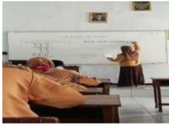
Gambar 4. Guru menuliskan soal di papan tulis

Setelah guru menjelaskan materi kemudian guru memberikan tantangan kepada siswa. Tantangan tersebut berupa soal dengan materi yang sudah dijelaskan tadi. Guru menuliskan soal di papan tulis, selanjutnya guru memberikan waktu kepada siswa untuk mengerjakan soal dibuku masing-masing. Kemudian guru memberikan kesempatan kepada siswa yang ingin menjawab soal yang ada di papan.