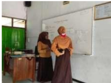
Gambar 7. Guru menerangkan materi kepada siswa yang belum paham

Dalam penyampaian materi pelajaran khususnya matematika, tak jarang dijumpai ada siswa yang dapat memahami materi yang diberikan guru, ada pula yang sebaliknya. Dalam penelitian yang dilakukan di SMP Negeri 3 Jombang, kemampuan siswa sangat beragam. Sehingga dalam menyampaikan materi matematika tentang persamaan linier dua variabel, selain metode ceramah guru juga memodifikasi dengan metode tanya jawab Hal ini dibuktikan dengan foto dibawah ini :