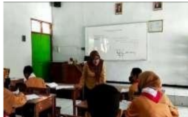
Gambar 3. Guru dan siswa melakukan Tanya jawab

Pada saat tanya jawab antara siswa dengan guru, guru juga sedikit mengulas materi yang telah dijelaskan di awal pembelajaran, tujuannya agar siswa tidak lupa. Beberapa kali guru juga bertanya kaitannya dengan materi yang sudah diterangkan dengan memberikan tebakan sederhana. Hal tersebut menjadikan siswa lebih responsif yang berarti bahwa siswa telah memahami materi dengan baik.