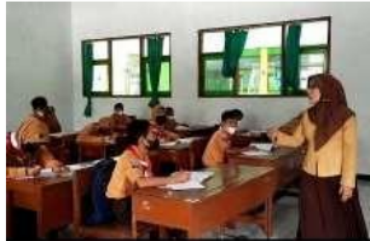
Gambar 2. Guru bertanya langsung kepada siswa

Pada saat siswa mengerjakan soal yang diberikan di papan, sering kali guru bertanya kepada beberapa siswa secara langsung datang ke bangku siswa untuk menanyakan apakah siswa sudah benar-benar mengerti apa masih bingung untuk mengerjakan soal yang sudah diberikan. Hanya saja sebagian siswa yang sudah mengerti dan menjawab kalau mereka sudah paham dan sudah hampir selesai dalam mengerjakan soal yang telah diberikan. Sebagian dari mereka hanya terdiam saja dan tidak bisa mengerjakan soal yang telah diberikan. Mereka hanya menunggu guru untuk menjelaskan kembali didepan. Setelah beberapa siswa sudah selesai mengerjakan, guru meminta siswa untuk maju dan menuliskan jawaban mereka di papan tulis. Keterlibatan langsung antara guru dan murid pada proses pembelajaran dibuktikan melalui gambar dibawah ini :