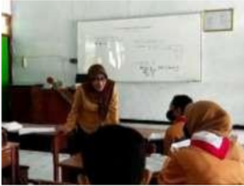
Gambar 6. Guru memberikan penguatan pada siswa

berupa soal cerita tentang persamaan linier dua variabel. Semua murid diminta untuk mengerjakan soal tersebut. Kurang lebih selama 10 menit, guru meminta salah satu murid untuk menuliskan jawabannya di papan tulis, lalu guru memeriksa hasil pengerjaan murid, apabila terdapat kesalahan maka tugas guru membenarkan hasil pengerjaan muridnya, jika benar maka tugas guru menguatkan dan mengingatkan materi yang telah diajar. Hal ini dibuktikan melalui foto dibawah ini :