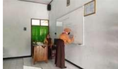
Gambar 5. Siswa mengerjakan soal di papan tulis

Dari wawancara yang dilakukan dengan guru, mendapatkan beberapa fakta yaitu selama pembelajaran online siswa kurang berinisiatif mengerjakan latihan soal secara mandiri. Hal ini menjadikan pacuan guru untuk memberikan soal-soal latihan agar siswa terbiasa dengan latihan soal. Sehingga siswa lebih percaya diri dalam menghadapi berbagai soal. Guru memang harus memahami karakter setiap siswa, ada yang cepat tanggap dan ada yang lambat dalam memahami materi. Menurut guru tantangan sangat penting untuk merangsang siswa dalam berpikir. Hal tersebut sesuai dengan teori medan dari Kurt Lewin, Kurt Lewin[13] mengemukakan bahwa siswa dalam belajar berada dalam suatu medan. Dalam situasi belajar siswa menghadapi suatu tujuan yang ingin di capai, tetapi selalu terdapat hambatan dalam mempelajari bahan belajar. Maka timbulah motif untuk mengatasi hambatan itu dengan mempelajari bahan belajar tersebut. Prinsip tantangan dalam belajar sesuai dengan pendapat Davies dalam Dimiyati. Apabila peserta didik diberikan tanggung jawab untuk mempelajari sendiri, maka lebih termotivasi untuk belajar. Ia akan belajar dan mengingat secara baik