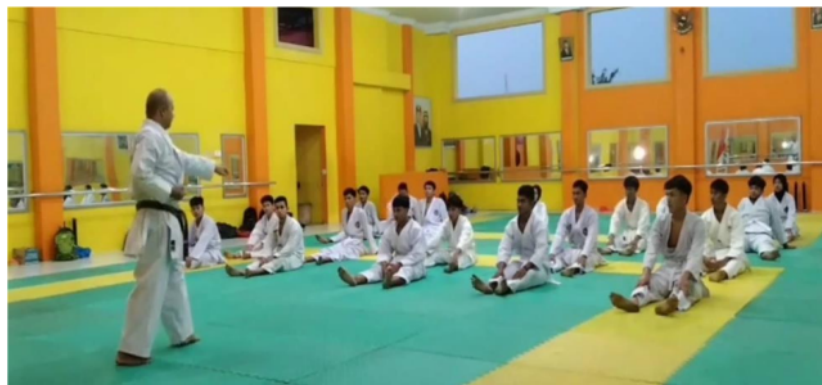
Gambar 1. Kegiatan Penyampaian Materi Gerakan

Pada kegiatan pengabdian ini memberikan implikasi yang berpengaruh terhadap pemahaman dan keterampilan mahasiswa tentang teknik dasar karate, oleh karena itu setelah mengikuti pelatihan ini memiliki bekal dalam pemahaman yang baik terkait teknik dasar olahraga karate. Kemampuan untuk melakukan kecakapan dalam olahraga karate sangat bergantung pada penguasaan teknik-teknik dasar secara menyeluruh serta gerakan eksplosif, sehingga sangat penting untuk menguasai teknik dasar dengan baik. Karena itu, sangat penting untuk menguasai teknik dasar dengan baik. Sehingga ketika di lingkungan pendidikan sebagai guru atau pelatih di ekstrakurikuler olahraga karate bisa menjadi referensi dan membantu secara tidak langsung bisa menerapkan pemahaman dan pengetahuan sehingga berdampak pada anak didik memiliki prestasi yang baik.