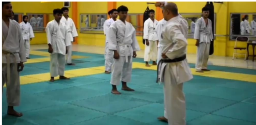
Gambar 3. Kegiatan Demonstrasi Gerakan Teknik Dasar