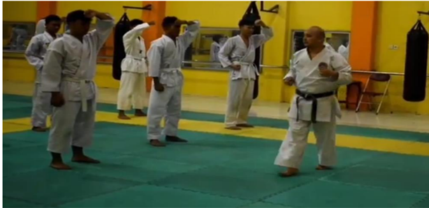
Gambar 2. Kegiatan Penyampaian Gerakan Teknik Dasar