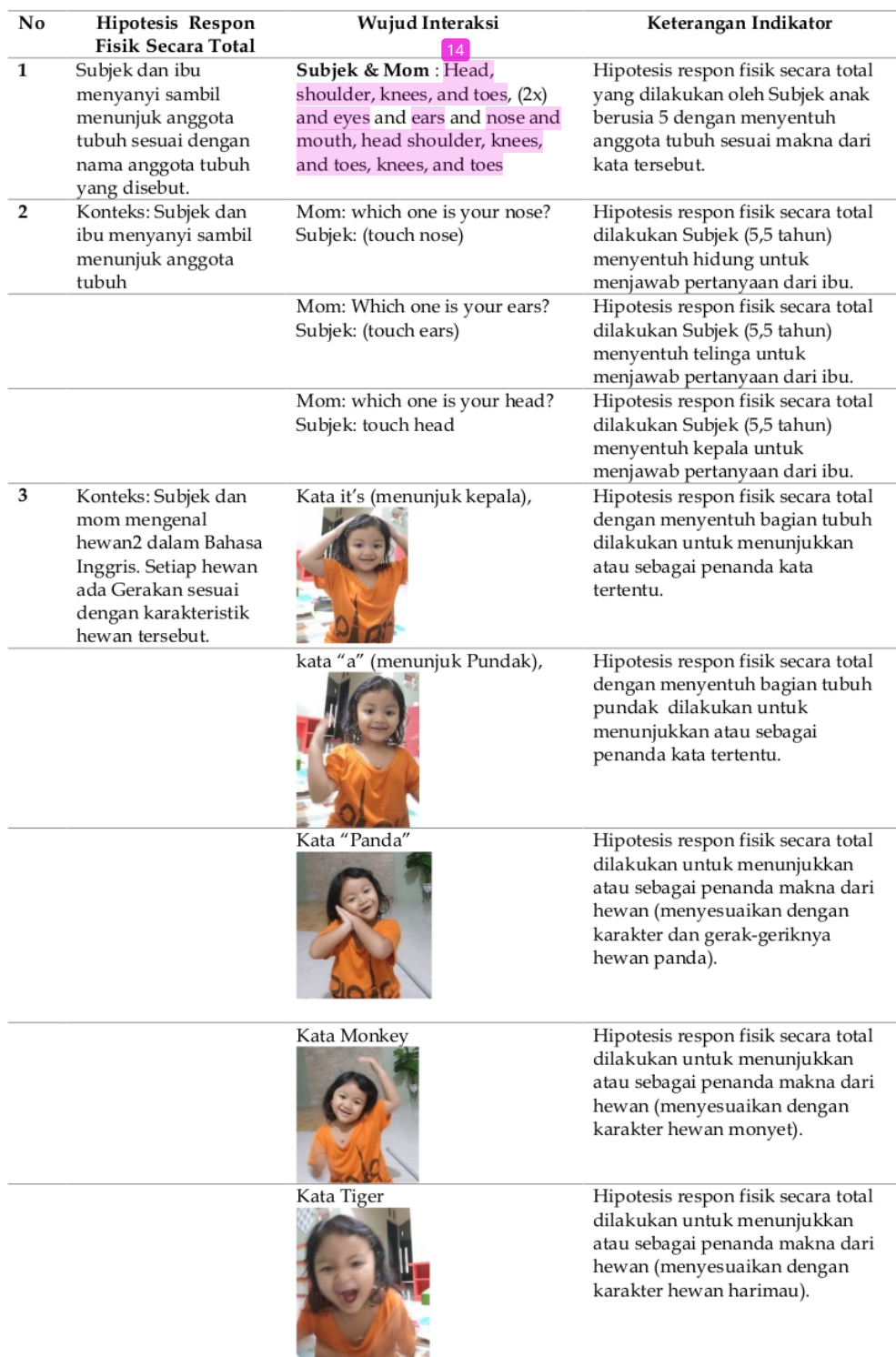
Tabel 4. Hipotesis Respon Fisik secara Total (dokumen peneliti) 2022