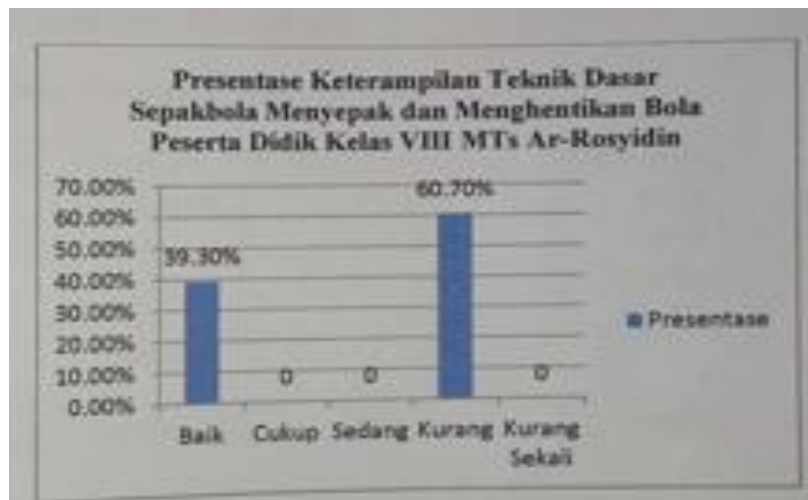
Gambar 4.3 Presentase Keterampilan Teknik Dasar Sepakbola Menyepak dan Menghentikan Bola Peserta Didik Kelas VIII MTS Ar-Rosyidin

Adapun hasil penghitungan tingkat keterampilan menyepak dan menghentikan bola peserta didik kelas VIII MTs. Ar-Rosyidin digambarkan dalam presentase dibawah ini: