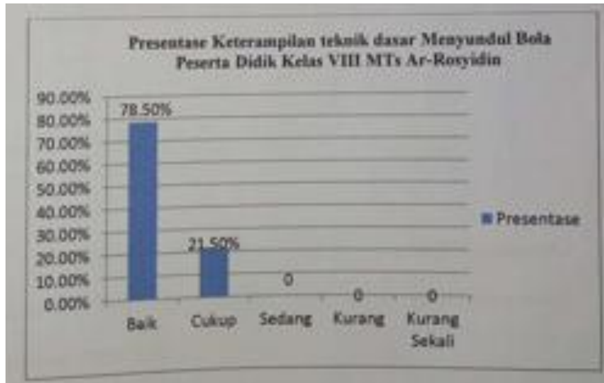
Gambar 4.1 Presentase Keterampilan teknik dasar Menyundul Bola Peserta Didik Kelas VIII MTS Ar-Rosyidin