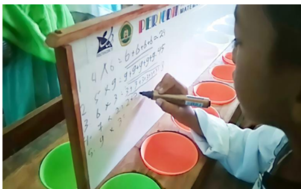
Gambar 9. Perkalian dengan PERIODIK

Pembagian merupakan pengurangan yang berulang. Peserta didik menuliskan soal di papan sekat (lihat bagian d Gambar 2). Peserta didik mengisikan sejumlah manik-manik pada lubang pertama (lihat bagian e Gambar 2), kemudian mengambil beberapa manik-manik sesuai dengan angka yang diminta dan mengisikan pada lubang kedua. Peserta didik lalu mengambil manik-manik lagi dan mengisikan ke lubang ketiga, keempat, dan seterusnya secara berulang hingga manik-manik di lubang yang pertama habis. Hasil pembagian merupakan jumlah lubang yang terisi manik-manik.