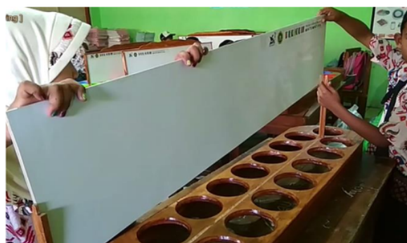
Gambar 11. PERIODIK mengasah soft skills

Berdasarkan Tabel 1, didapatkan nilai sig 0.000 pada kemampuan keterampilan, kegigihan dan kerja sama sehingga \text{sig} < \alpha , maka H_0 ditolak, artinya terdapat perbedaan rata-rata soft skills sebelum dan sesudah pemakaian alat peraga. Alat peraga PERIODIK bermanfaat bagi peserta didik dan guru. Terbukti alat peraga ini 1) berpengaruh positif bagi peserta didik dalam mempelajari operasi dasar matematika (penjumlahan, pengurangan, perkalian, dan pembagian) serta 2) berpengaruh positif pada soft skills (keterampilan, kegigihan, dan kerja sama) peserta didik. Penilaian soft skills dan kemampuan matematika dilaksanakan pada setiap individu walaupun dalam penggunaan alat peraga secara kelompok (Gambar 11).