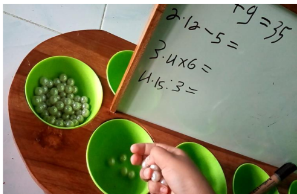
Gambar 7. Penjumlahan dengan PERIODIK

Peserta didik menuliskan soal di papan sekat (lihat bagian d Gambar 2). Sejumlah manik-manik diisikan pada lubang pertama (lihat bagian e Gambar 2). Beberapa manik-manik dari lubang yang pertama diambil dan diisikan ke lubang yang kedua. Peserta didik menghitung manik-manik yang tersisa di lubang pertama. Hasil pengurangan merupakan sisa manik-manik di lubang yang pertama.