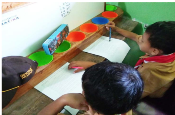
Gambar 10. Pembagian dengan PERIODIK

Sebagai contoh: peserta didik menuliskan " 12:4 = \dots " di papan sekat. Peserta didik mengisikan 12 manik-manik ke lubang pertama. Peserta didik mengambil 4 manik-manik dari lubang pertama, lalu mengisikannya ke lubang kedua. Peserta didik mengambil 4 manik-manik lagi dari lubang pertama, lalu mengisikannya ke lubang ketiga. Peserta didik mengambil 4 manik-manik lagi dari lubang pertama, lalu mengisikannya ke lubang keempat. Manik-manik di lubang yang pertama habis. Peserta didik menghitung jumlah lubang yang terisi manik-manik ada 3 lubang. Jadi, hasil dari 12:4 adalah 3 (Gambar 10).