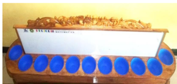
Gambar 1. Alat peraga PERIODIK

Tes tulis yang diberikan kepada peserta didik diolah menggunakan uji perbedaan rata-rata satu sampel dengan test value 86. Apabila nilai rata-rata peserta didik sama dengan 86, peserta didik telah memahami materi operasi dasar. Hal ini disebabkan nilai ketuntasan minimal yang ditetapkan sekolah tidak kurang dari 80. Dengan demikian, hipotesis pengujian dalam hal ini adalah H_0: \mu_1 = 86 atau nilai tes tulis setelah pembelajaran menggunakan alat peraga sama dengan 86. H_1: \mu_1 > 86 atau nilai tes tulis setelah pembelajaran paling rendah 86. Menggunakan cara pengujian tolak H_0 apabila nilai \text{sig} < \alpha atau t_{\text{hitung}} > t_{\text{tabel}} (Rozak & Hidayati, 2019; Siregar, 2013). Alat serta bahan yang digunakan untuk pengadaan alat peraga PERIODIK (Gambar 1) terdiri atas kayu alas yang telah diberikan lubang, kayu sekat, ukiran kayu, kaleng plastik, dan lem.