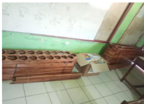
Gambar 3. Alat peraga siap digunakan