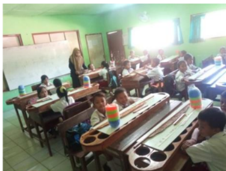
Gambar 5. Pengenalan PERIODIK

Pelaksanaan kegiatan ini dilaksanakan dalam dua belas pertemuan. Setiap pertemuan berlangsung empat jam. Diawali dengan pemberian presepsi dan pengenalan alat peraga kepada peserta didik SDN Kedungmlati (Gambar 5). Proses selanjutnya adalah merangkai alat peraga (Gambar 6). Setelah alat peraga dirangkai, alat peraga diuji coba, kemudian siap digunakan. Tim memandu peserta didik belajar operasi dasar menggunakan alat peraga ini. Pelaksanaan kegiatan ini disaksikan oleh guru kelas, selanjutnya guru kelas nantinya secara mandiri dapat memanfaatkan alat peraga ini pada pembelajaran matematika untuk generasi selanjutnya.