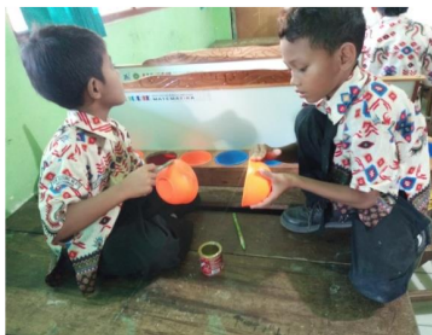
Gambar 6. Peserta didik merangkai PERIODIK

Peserta didik menuliskan soal di papan sekat (lihat bagian d Gambar 2). Sejumlah manik-manik diisikan pada lubang pertama (lihat bagian e Gambar 2). Lubang kedua diisi dengan sejumlah manik-manik sesuai dengan angka yang diminta. Peserta didik mengumpulkan manik-manik dari lubang pertama dan lubang kedua, kemudian menghitung keseluruhan manik-manik. Hasil penjumlahan merupakan seluruh manik-manik dari kedua lubang.