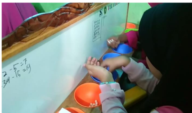
Gambar 8. Pengurangan dengan PERIODIK

Sebagai contoh: “ 8 - 5 = \dots ” dituliskan di papan sekat. Lubang pertama diisi 8 manik-manik. Ambil 5 manik-manik dari lubang pertama dan letakkan pada lubang kedua. Peserta didik menghitung manik-manik yang tersisa di lubang yang pertama (Gambar 8).