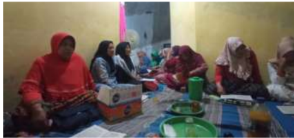
Gambar 1. Warga Tidak Menggunakan Masker dalam Acara Pengajian Rutin

(Gambar 1). Maka dari itu Kami bersama tim bertujuan membantu masyarakat Desa Rejoslamet untuk dapat menerapkan perilaku hidup sehat di era pandemi dengan cara lebih patuh pada protokol kesehatan. Tim pengabdian mengadakan program penguatan patuh protokol kesehatan dengan bahasa yang mudah dipahami, serta pelatihan pembuatan strap masker dengan bahan yang mudah didapat, ekonomis, ramah lingkungan dan mudah pembuatannya sebagai upaya pencegahan penularan covid-19 varian omicron.