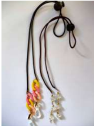
Gambar 5. Strap Masker yang Dihasilkan