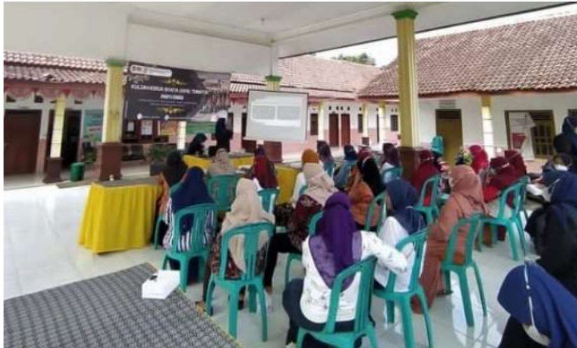
Gambar 3. Pengutan Pentingnya Menerapkan Protocol Kesehatan