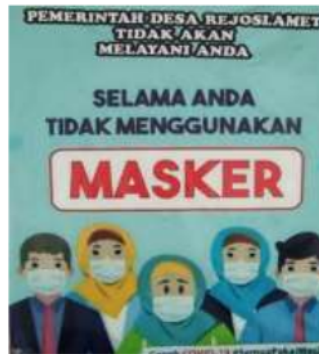
Gambar 2. Poster Himbauan Menggunakan Masker