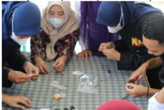
Gambar 4. Praktek Pembuatan Strap Masker

Pelatihan berupa praktek pembuatan strap masker. Berikut adalah foto kegiatan dalam pembuatan strap masker (Gambar 4) dan hasil skrap masker (Gambar 5).