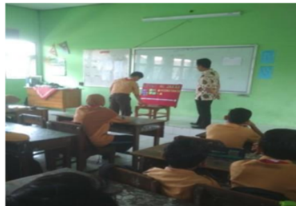
Gambar 3. Siswa Mempresentasikan Hasil Pekerjaan