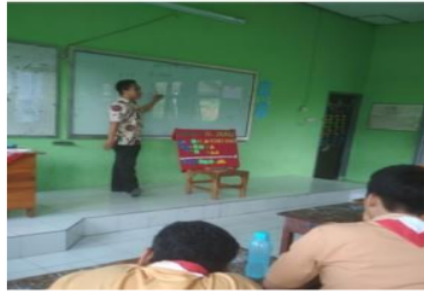
Gambar 2. Guru Memfokuskan Siswa pada Masalah