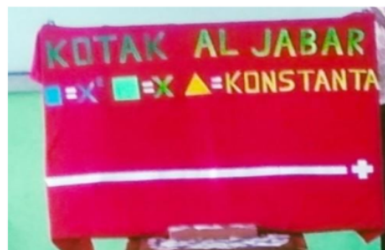
Gambar 1. Media Kotak Aljabar

1) Guru mengorientasikan siswa pada masalah. Hal ini dilakukan guru dengan memberikan masalah dalam kehidupan sehari-hari yang terkait dengan operasi aljabar. Guru memberikan masalah tersebut secara lisan dan tertulis, kemudian menunjukkan media kotak aljabar untuk membantu dalam menyelesaikan masalah. Selanjutnya guru menunjukkan cara kerja dari kotak aljabar.